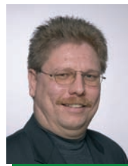
Alfred Halmetschlager Buchhaltung, Lohnverrechnung, EDV