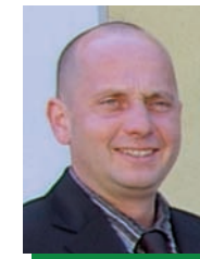
Karl Holzweber Wirtschaftshof